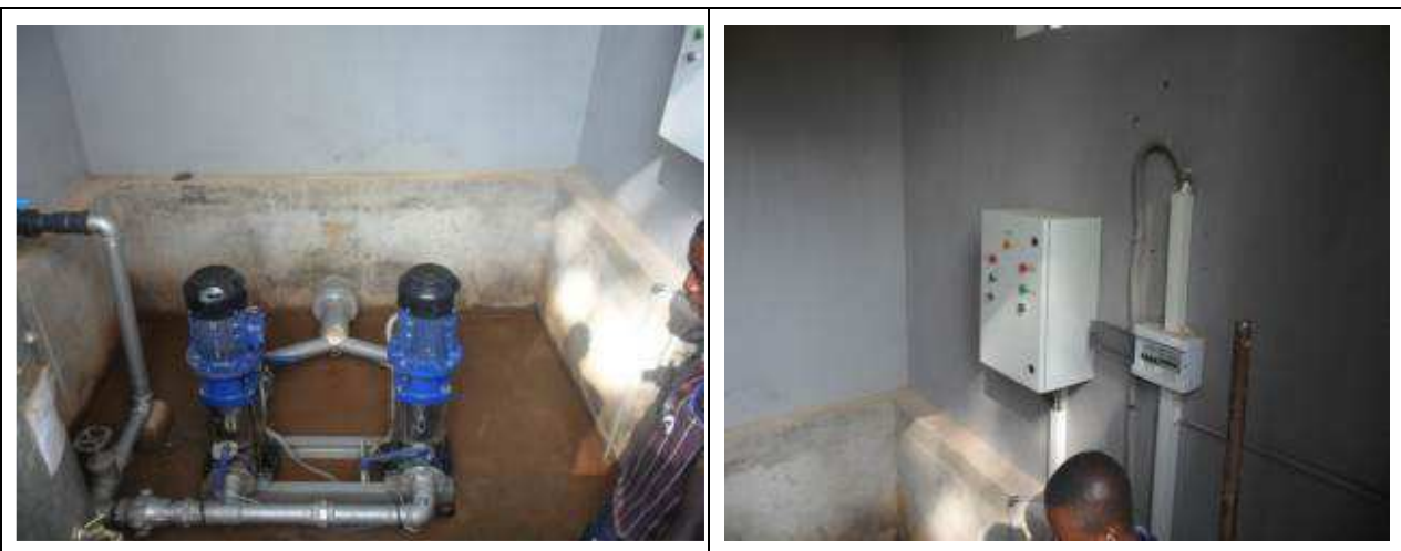
Illustration des travaux constatés

Tous les travaux ont été exécutés conformément au marché. Aucune malfaçon, ni dégradation n'a été constatée lors de l'inspection des travaux.