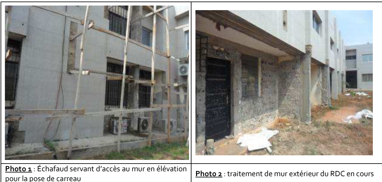
Illustration des travaux constatés